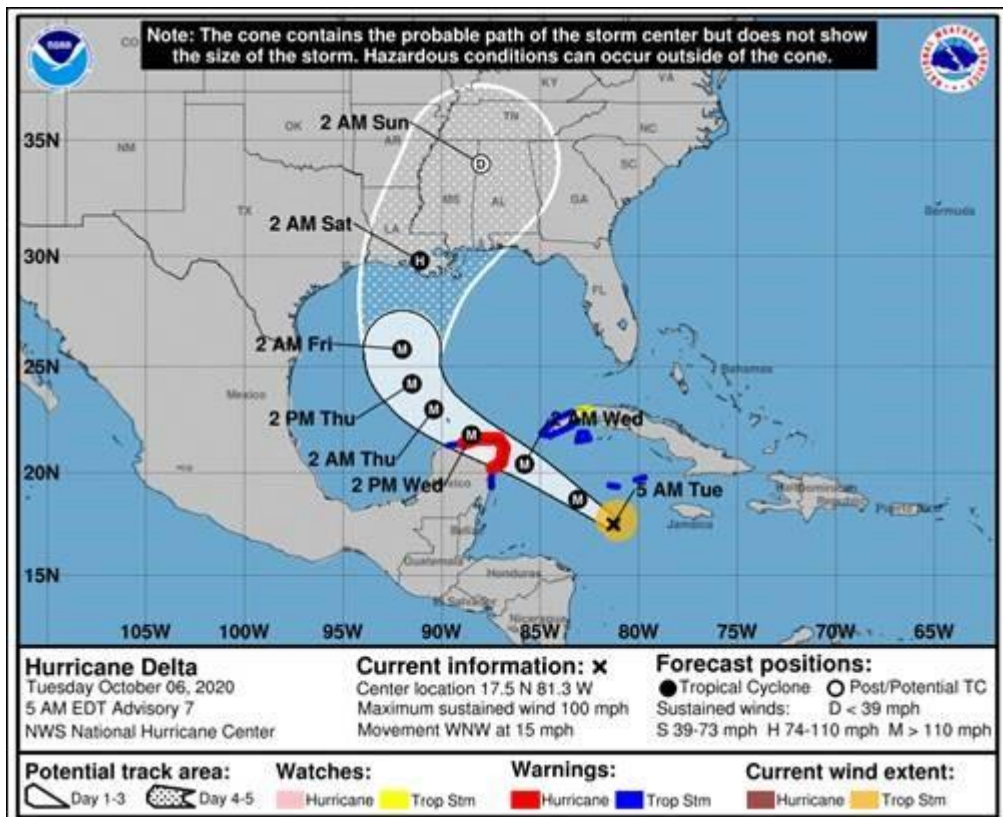
Imagen 2: Hay advertencias de huracán para México y advertencias de tormenta tropical para Cuba.