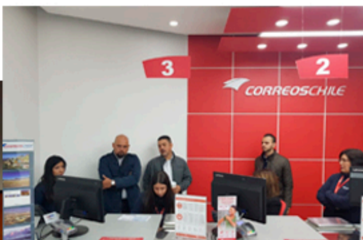
Visita inspectiva en sucursal de CorreosChile