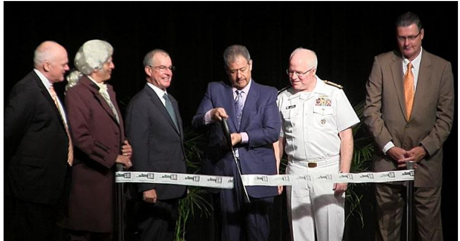
Imagen de las autoridades en la ceremonia de inauguración