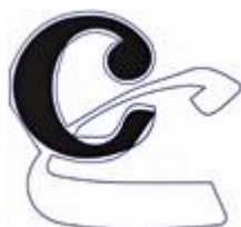
Los Collectors Club