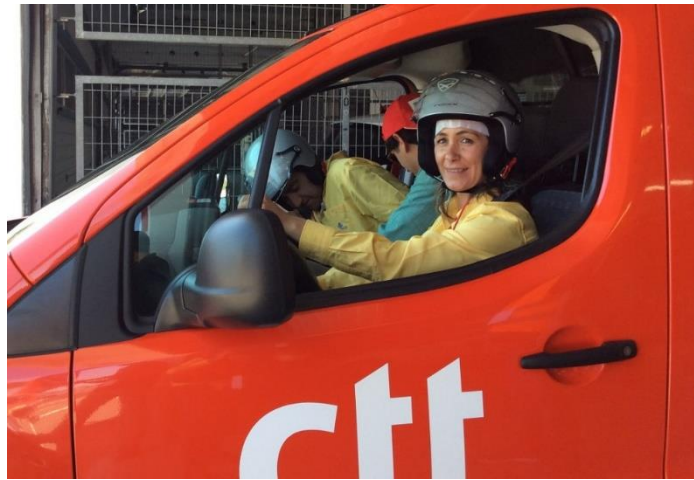
Conductores del equipo Correos España.

La carrera, organizada por la International Post Corporation (IPC), que reúne a 24 servicios postales y cinco millones de carteros de Asia, Europa y América del Norte), se enmarca dentro de su programa de conducción ecológica y lucha contra el cambio climático, indicó hoy su responsable de sostenibilidad, Pieter Reitsma.