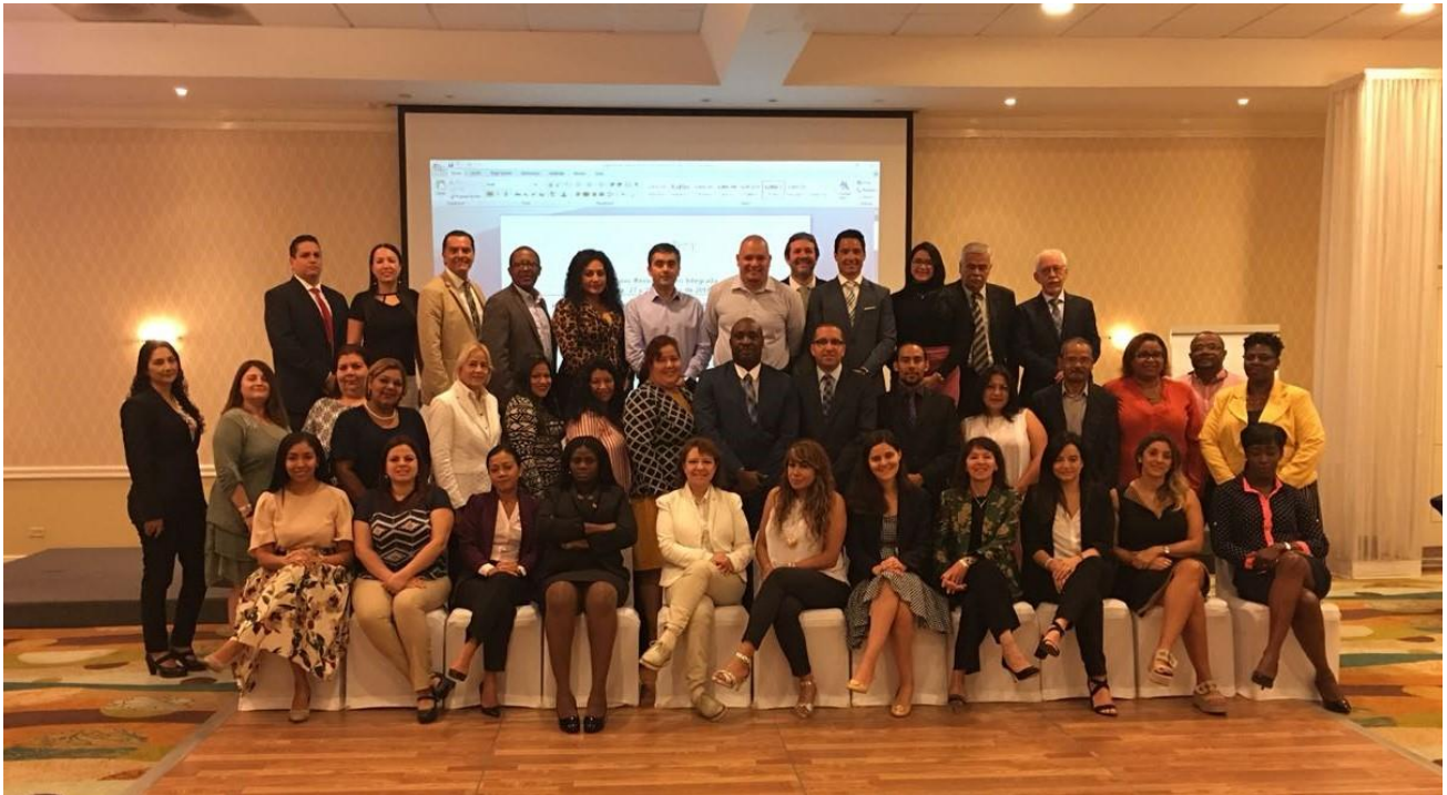
Foto Grupal de los participantes al Seminario