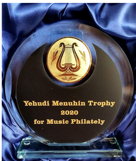
Imagen del trofeo

La selección de los sellos musicales más bellos la llevan a cabo coleccionistas de sellos musicales de todo el mundo desde 1980. Motivgruppe Musik e.V. premia al diseñador de los sellos musicales más bellos con el "Trofeo Yehudi Menuhin". El trofeo se otorga en memoria del gran violinista y director Lord Yehudi Menuhin, quien fue el patrón del Círculo de Música Filatélica durante 30 años, desde 1969 hasta su muerte en 1999.