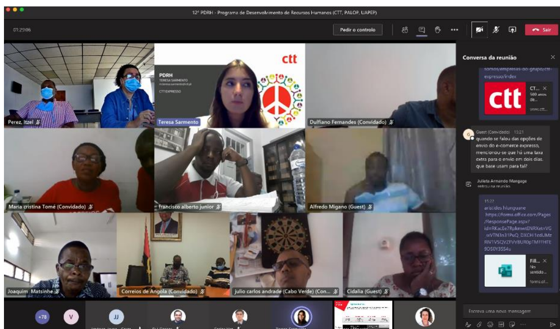
Los participantes durante la capacitación online de CTT Expresso.

Esta edición, dedicada de nuevo a la Oferta y Operaciones Postal de CTT, permitió un viaje virtual sobre temas como el marco estratégico e institucional de la empresa, Filatelia, Productos Financieros, Soluciones Comerciales, Marca y Comunicación, Comercio Electrónico, Banco Postal y relaciones operativas con Aduanas, así como la organización y Desarrollo de la Producción Logística desde la perspectiva del Tratamiento y Transporte.