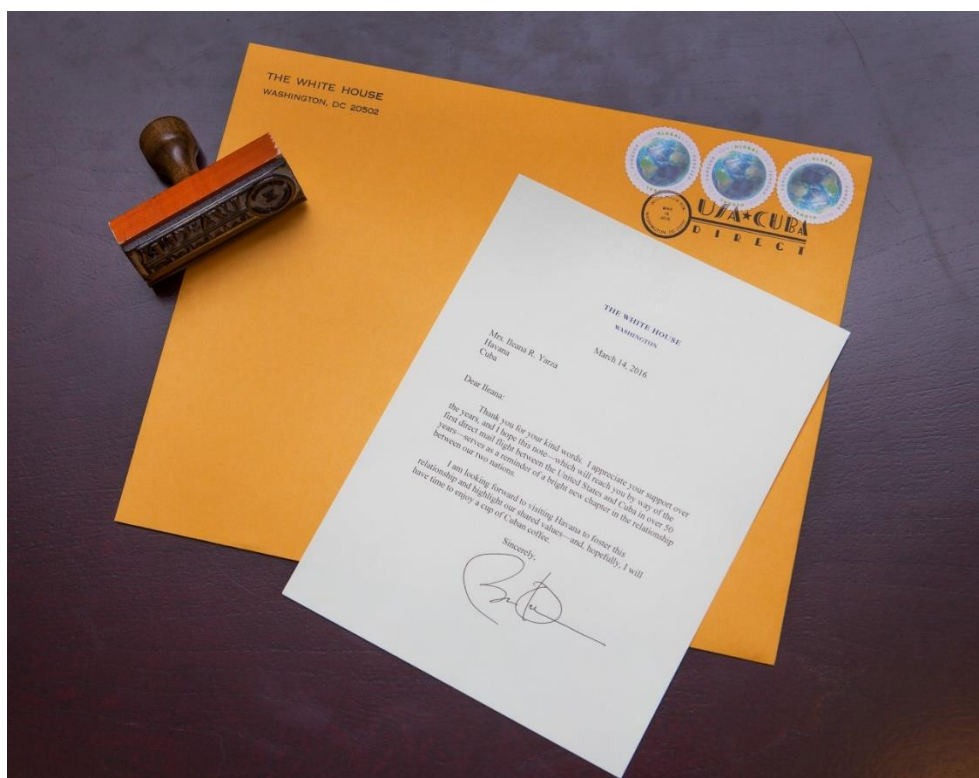
Carta escrita por el Presidente de EE-UU Barack Obama con destino a Cuba

http://pe.usps.gov/text/imm/ce_017.htm#ep1416554 .