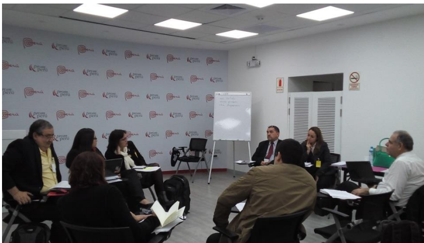
Reunión de trabajo del equipo de Paraguay