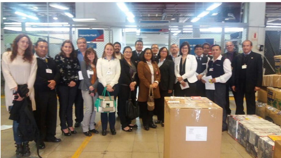
El paquete en el Centro de clasificación de Serpost