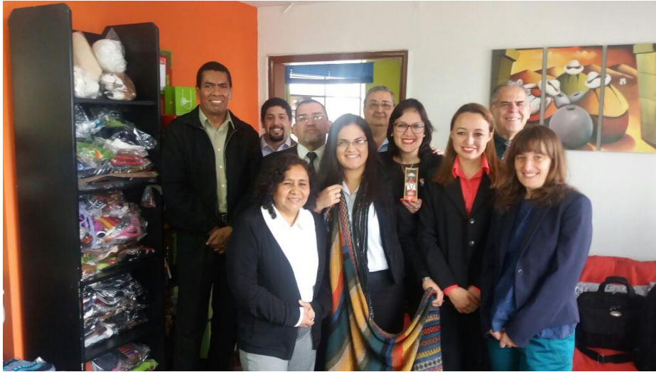
Visita a una MIPYME usuaria de Exporta Fácil PERÚ