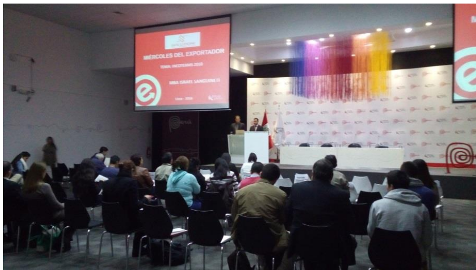
Asistiendo al "Miércoles del exportador" organizado por Promperú