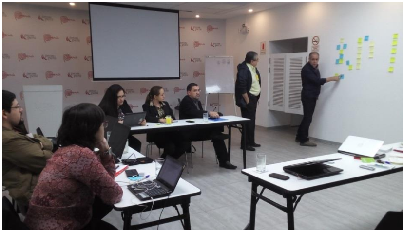
Reunión de trabajo del equipo de Paraguay