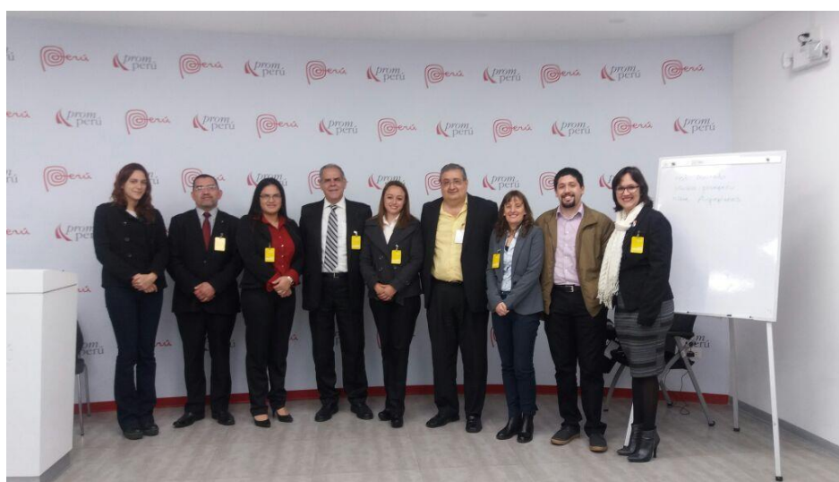
Equipo Exporta Fácil Paraguay y Equipo de Coordinación general del proyecto

A continuación, algunas fotos de la semana: