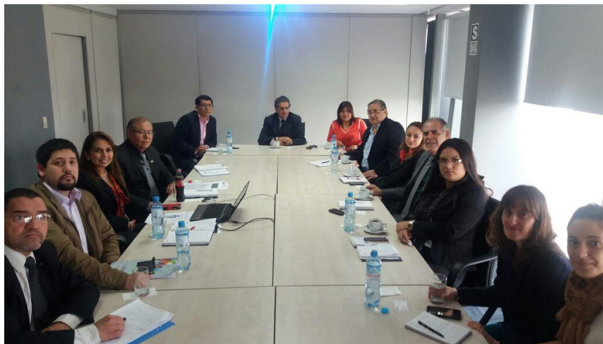
Reunión con la Asociación de exportadores (ADEX)