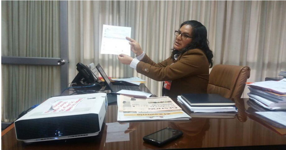
La responsable de una MIPYME rellena la Declaración Exporta Fácil