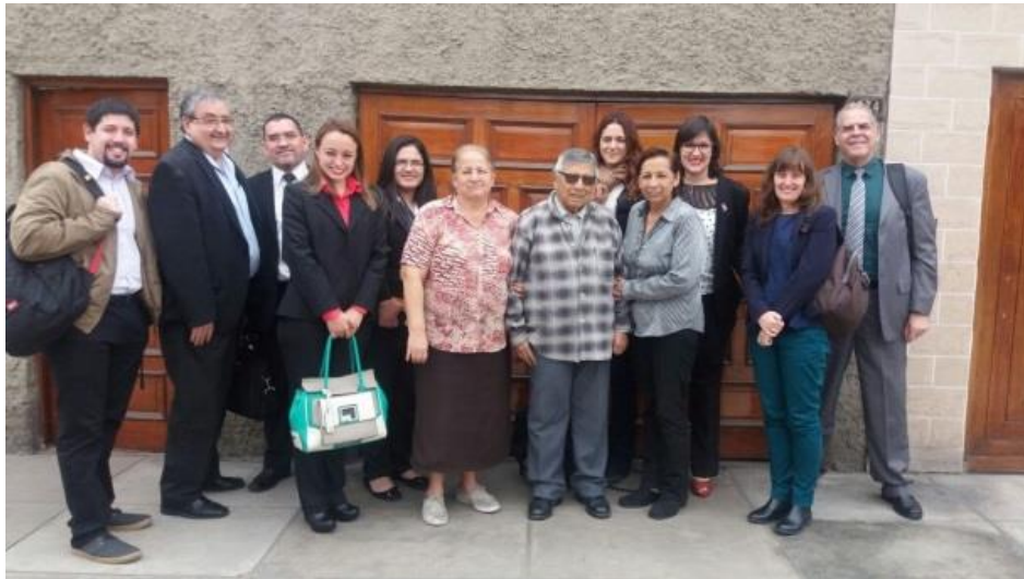
Visita a una MIPYME usuaria de Exporta Fácil PERÚ