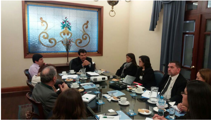
Reunión con la Cámara de Comercio de Lima