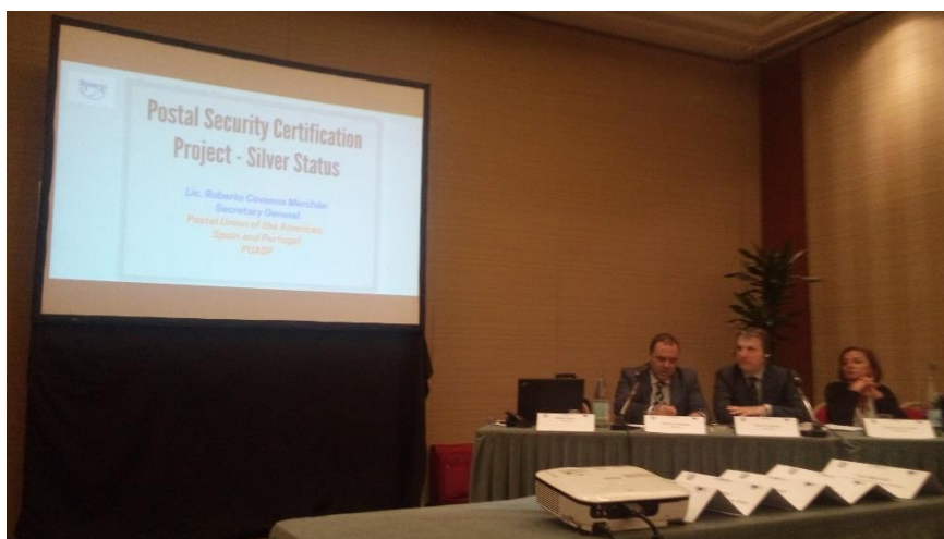
Vista del estrado durante la exposición