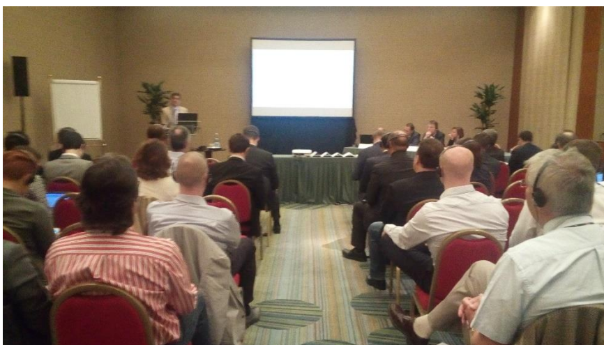
Vista del público presente en el Foro

La UPAEP agradece al Sr. Botond la invitación y la financiación de los representantes de la Secretaría General y a todos los que hicieron posible que la UPAEP esté presente en tan importante Forum.