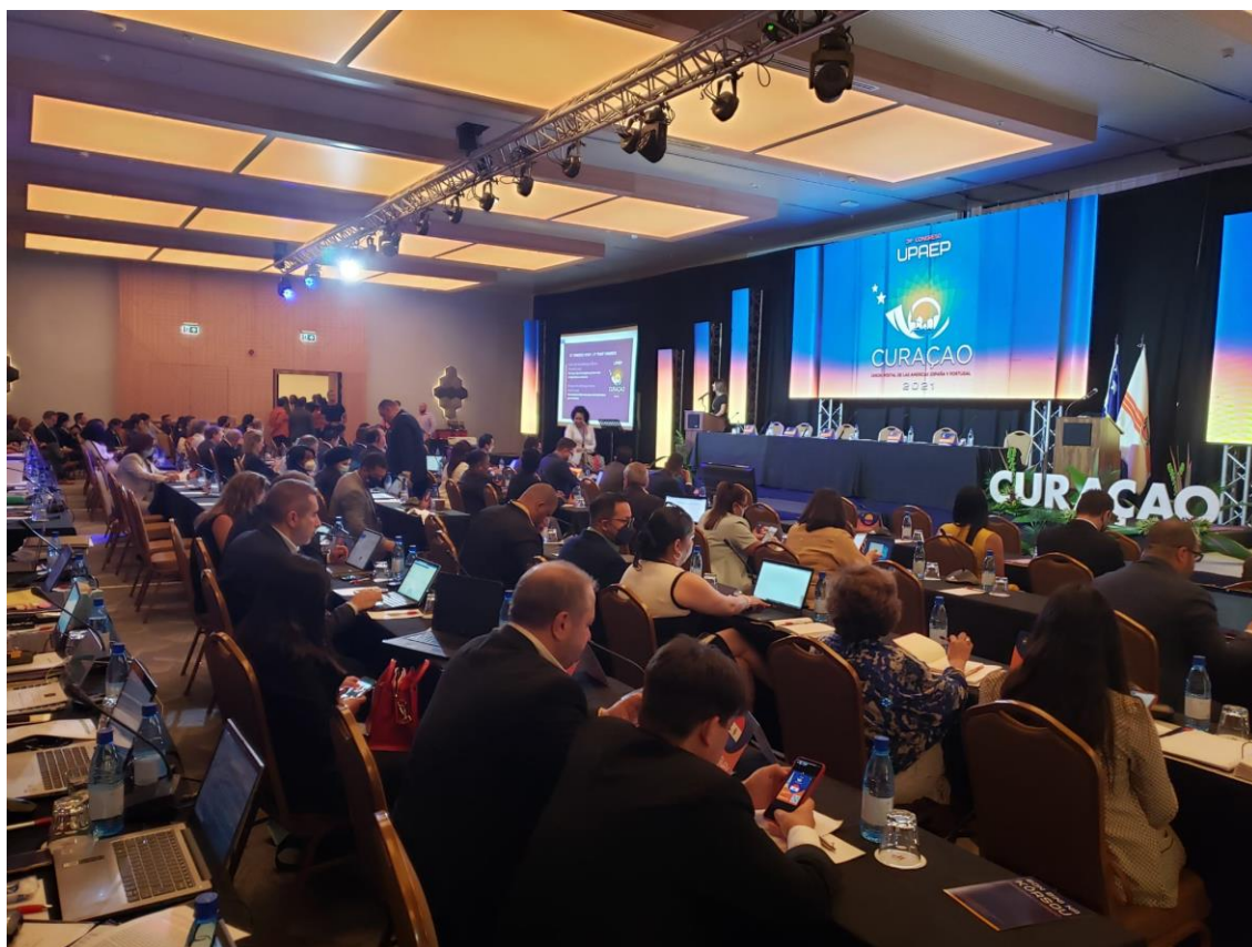
Momento de la bienvenida al 24º Congreso de la UPAEP