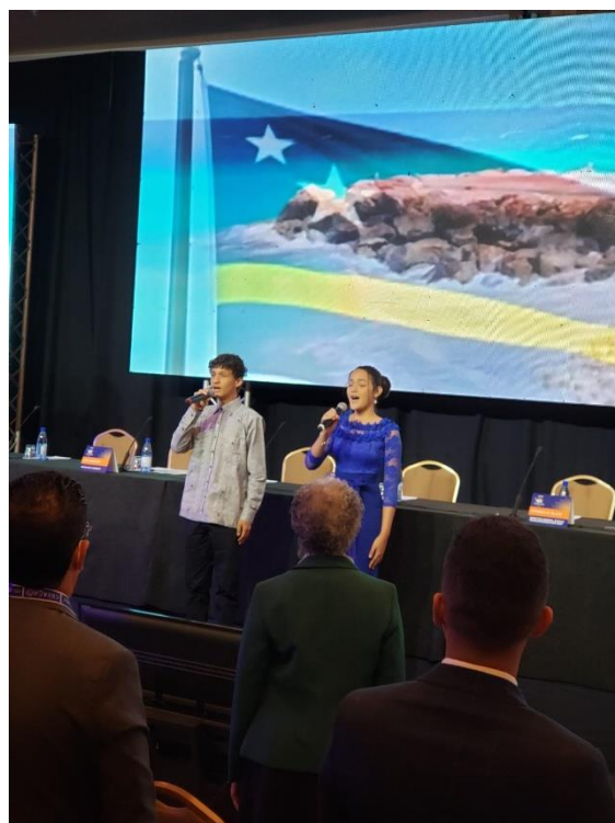
Durante la inauguración cantando el himno oficial de Curaçao